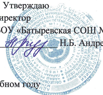
График питания обучающихся в 2023-2024 учебном году

(корпус начальной школы: ул. А.П. Табакова, дом 29А)